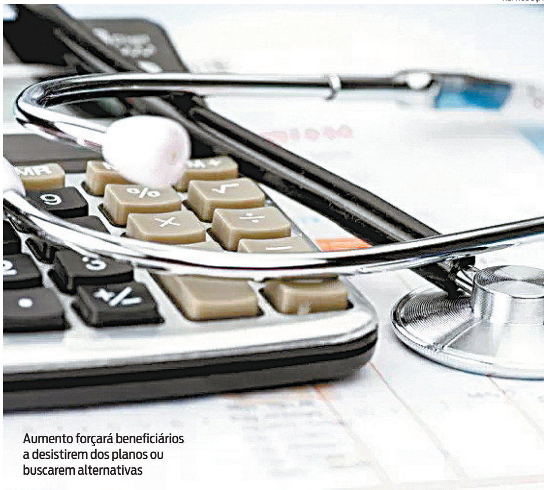
Aumento forçará beneficiários a desistirem dos planos ou buscarem alternativas

"A ANS tem se preocupado em avaliar o desempenho